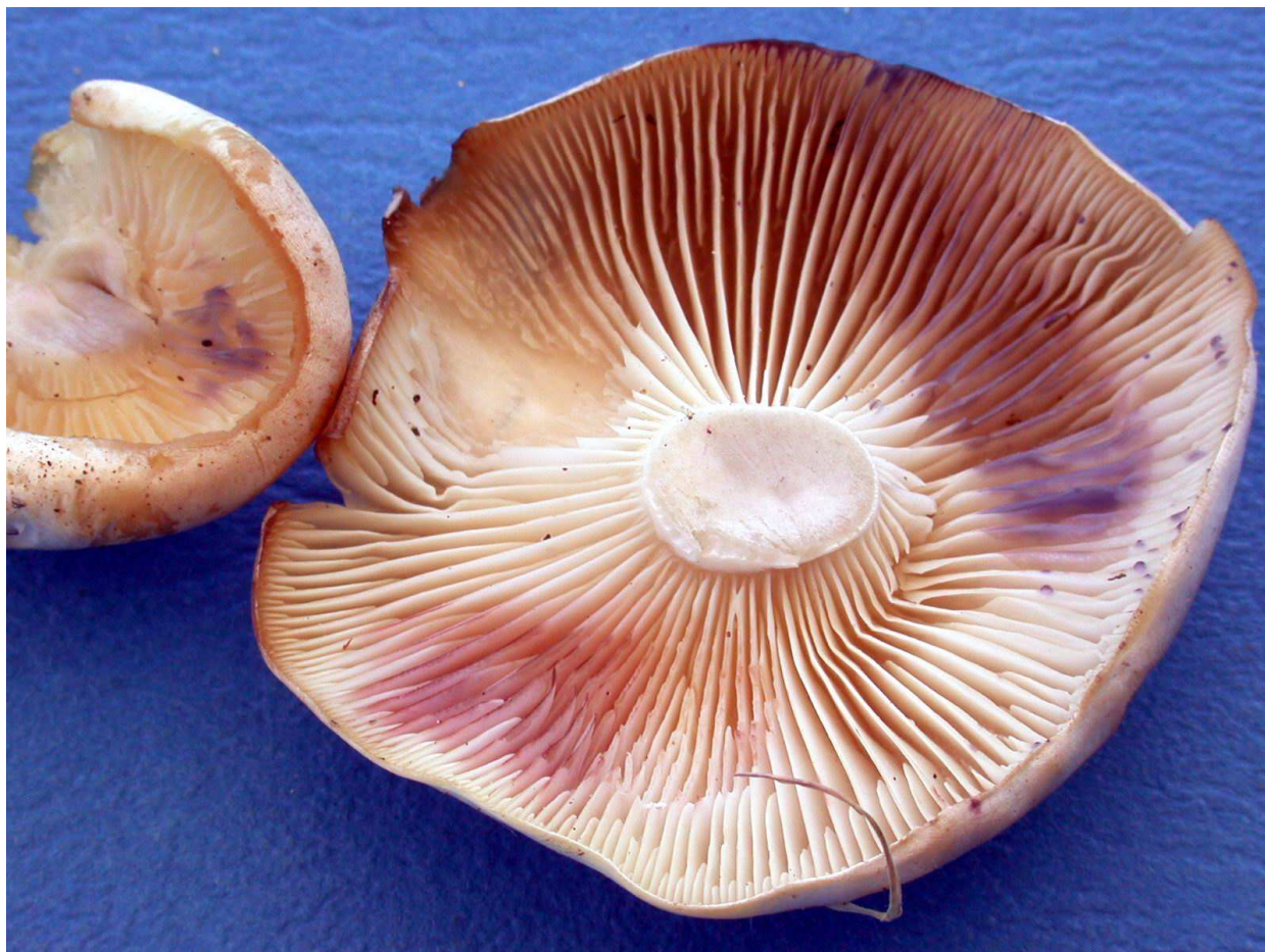
Réaction immédiate sur les lames de Lyophyllum connatum ▲ et sur le pied de Russula foetens ▼

Cependant, nous avons réussi à stabiliser cette solution aqueuse, ce qui permet de la conserver limpide de manière permanente ! Pour l'utiliser sur le pied des russules, d'abord gratter pour mettre la chair à nu et ensuite, appliquer le réactif !