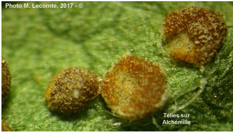
Télie sur Alchémille