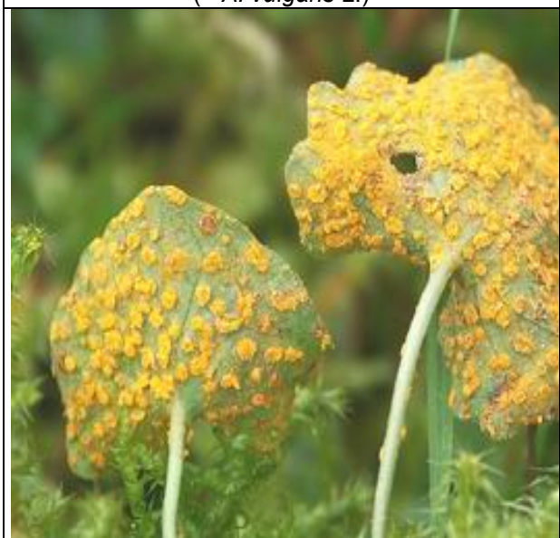
Écidies sur face inférieure de la feuille