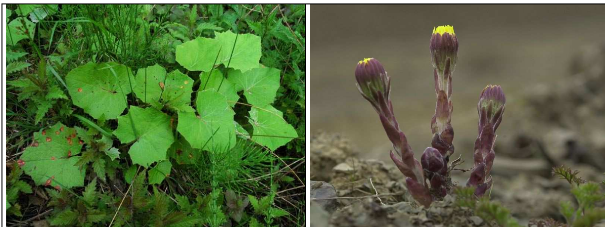
Les fleurs viennent avant les feuilles