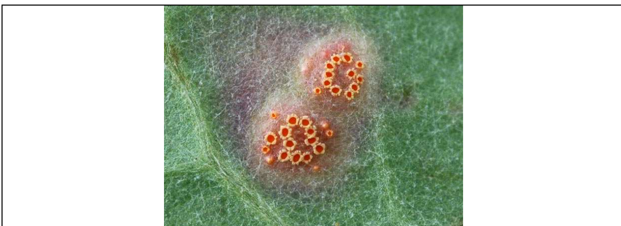
Ecidies et écidiospores