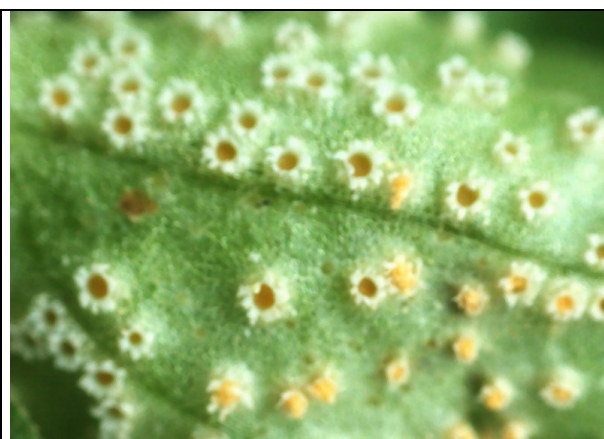
Détail avec écidiospores jaune d'or