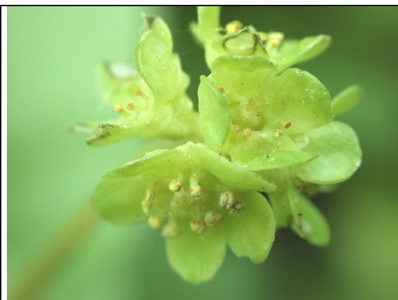
Détail de la fleur