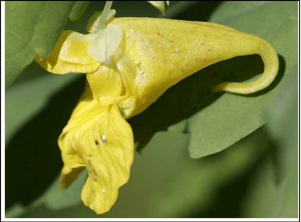
Impatiens noli-tangere L. : plant et détail de la fleur