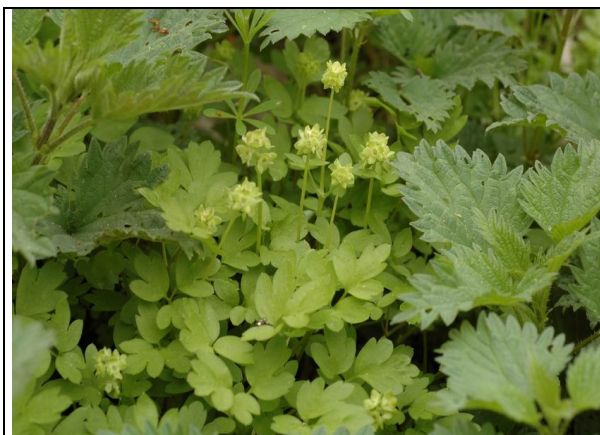
Détail de la fleur