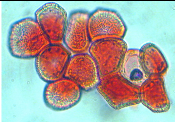
Cellules péricyales colorées au Rouge Congo SDS