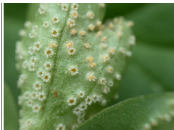
Écidies au printemps (avril)