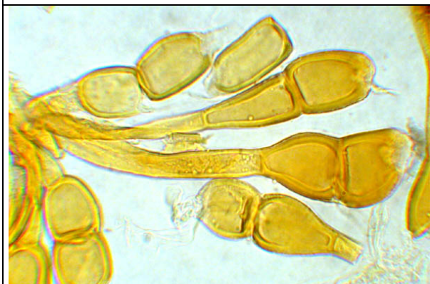
Téleutospores colorées au Melzer