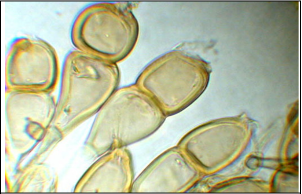
Téleutospores observées dans l'eau