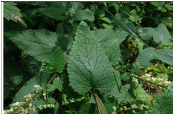
Détail de la feuille