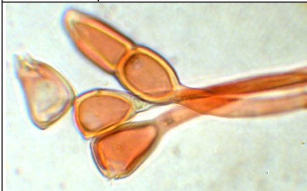
Téleutospores colorées au rouge Congo