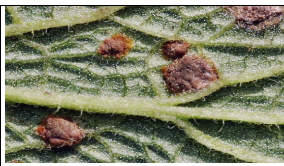
Sores à téléutospores, foliicoles, roux à brunâtre clair, compacts et non pulvérulents