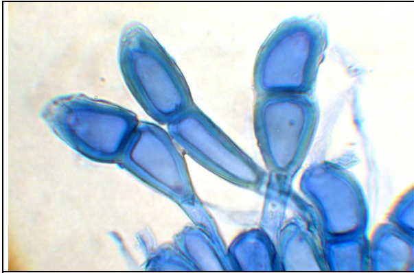
Téleutospores colorées au bleu coton