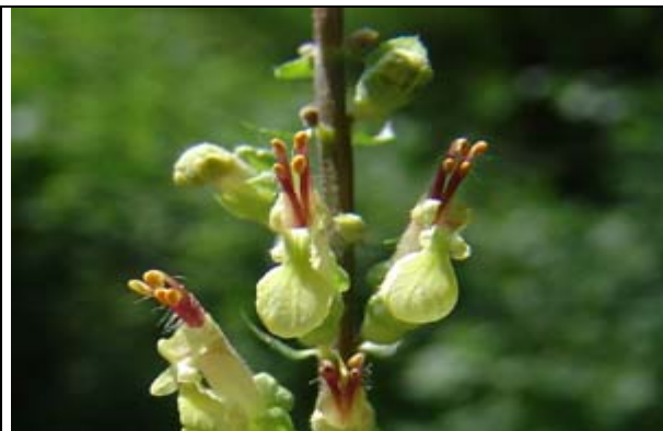
Détail de la fleur