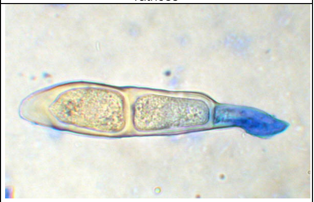
Détail de téléutospore colorée au BCoton