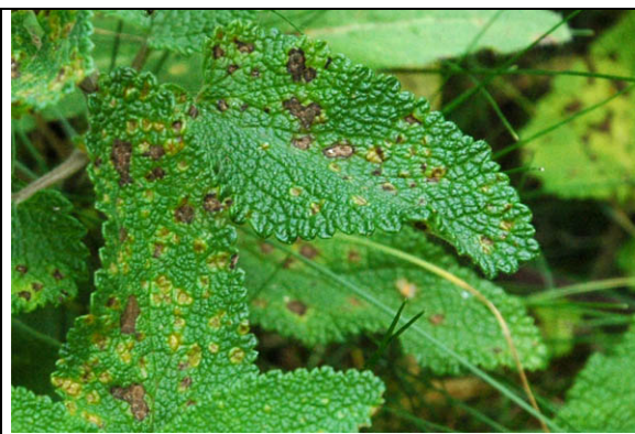
Taches sur les feuilles indiquant la présence de sores à la face inférieure