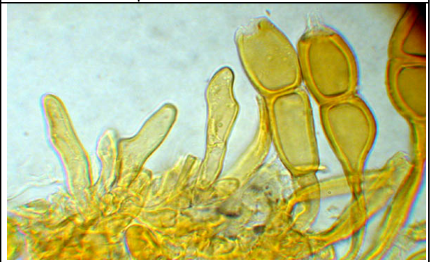
Téleutospores colorées au Melzer + hyphes génératrices