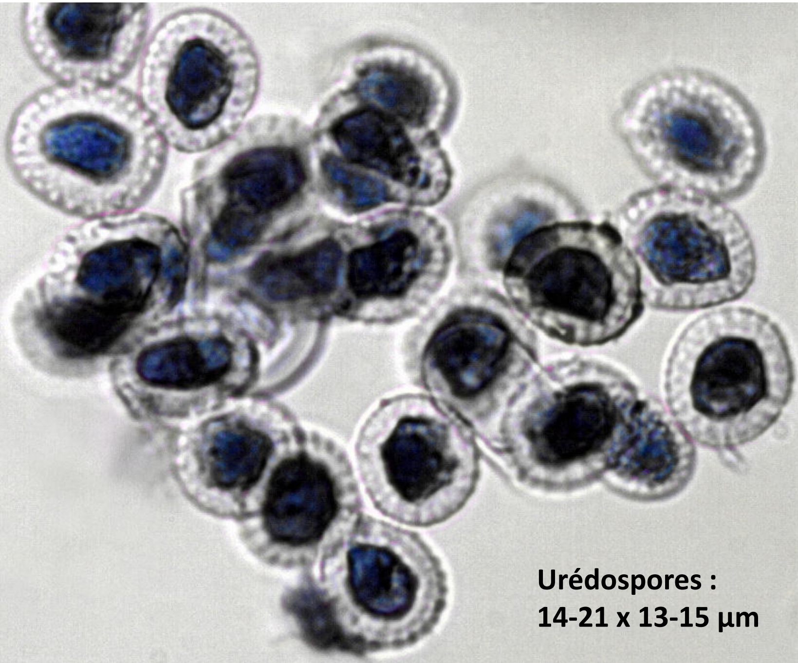
Urédospores : 14-21 x 13-15 \mu\text{m}