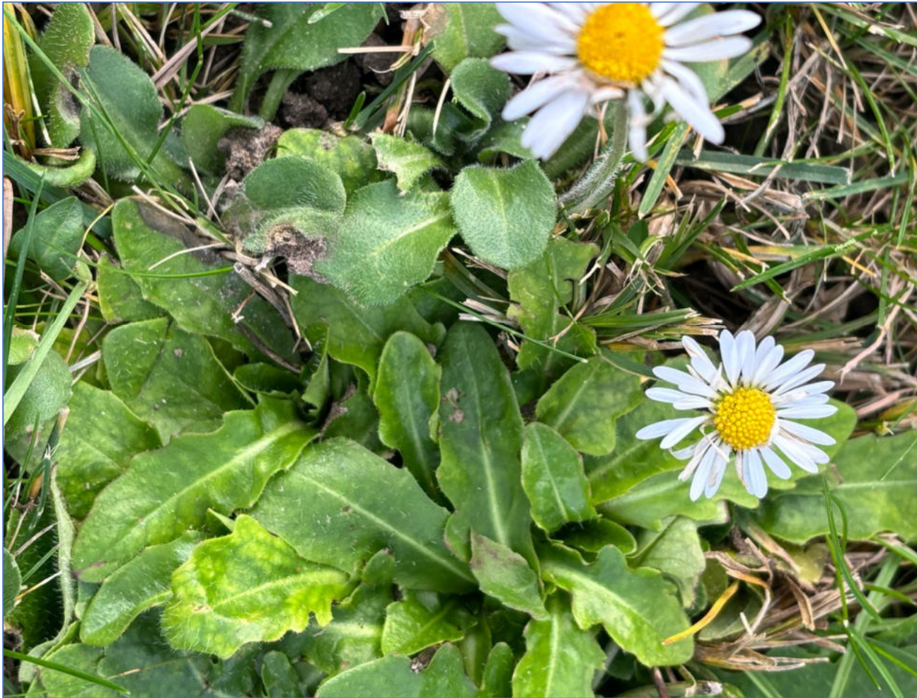
Stade II de Puccinia obscura sur Bellis perennis (pâquerette) Fiche conçue et réalisée par Daniel Deschuyteneer