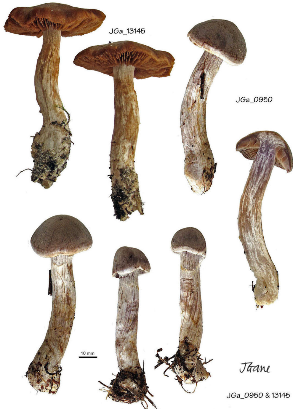
Cortinarius poppyzon Melot

Cailleux A. , Code des Couleurs des Sols, édit. Boubée (Cail.). RVB , Code des Couleurs numériques Rouge-Vert-Bleu (RVB). Séguy , Code Universel des Couleurs, Éditions Lechevalier (Ség.). Henriot A. , Piximètre, Logiciel de mesure de dimensions sur images, ach.log.free.fr/piximetre .