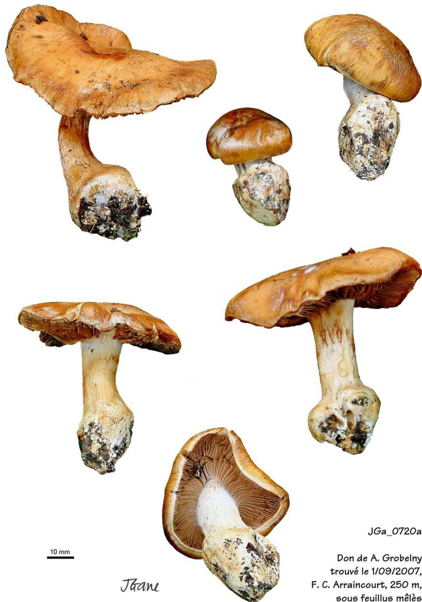
Cortinarius malleatus Bid. & Fillion

Henriot A. , Piximètre, Logiciel de mesure de dimensions sur images, ach.log.free.fr/piximètre.