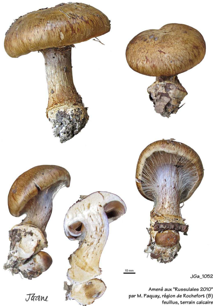
Cortinarius magicus Eichhorn

Henriot A. , Piximètre, Logiciel de mesure de dimensions sur images, ach.log.free.fr/piximètre .