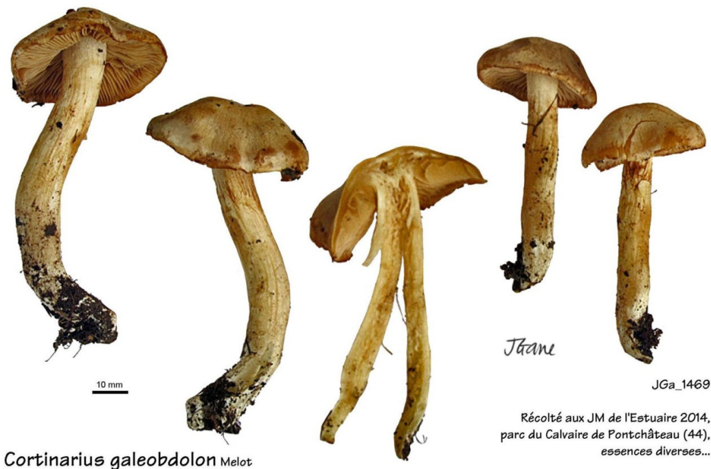
Cortinarius galeobdolon Melot

Henriot A. , Piximètre, Logiciel de mesure de dimensions sur images, ach.log.free.fr/piximetre .