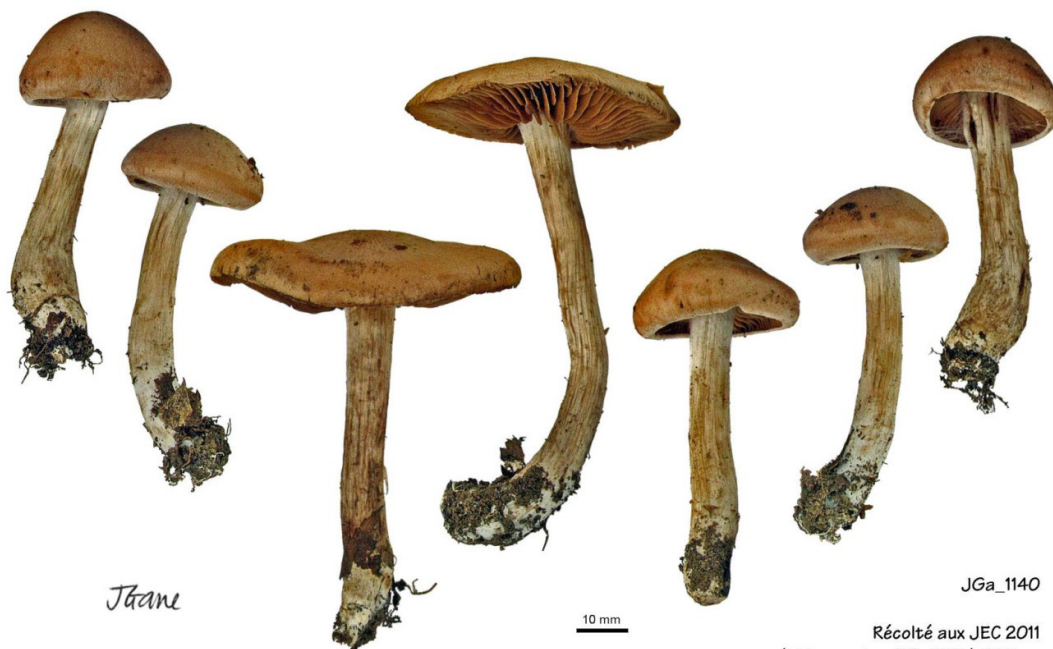
Cortinarius depexus (Fries) var. luminosus Carteret

Henriot A., Piximètre, Logiciel de mesure de dimensions sur images, ach.log.free.fr/piximètre.