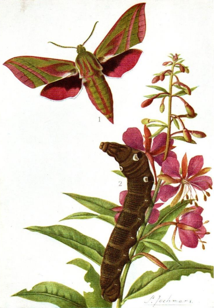
36. — Deilephila elpenor LINNÉ