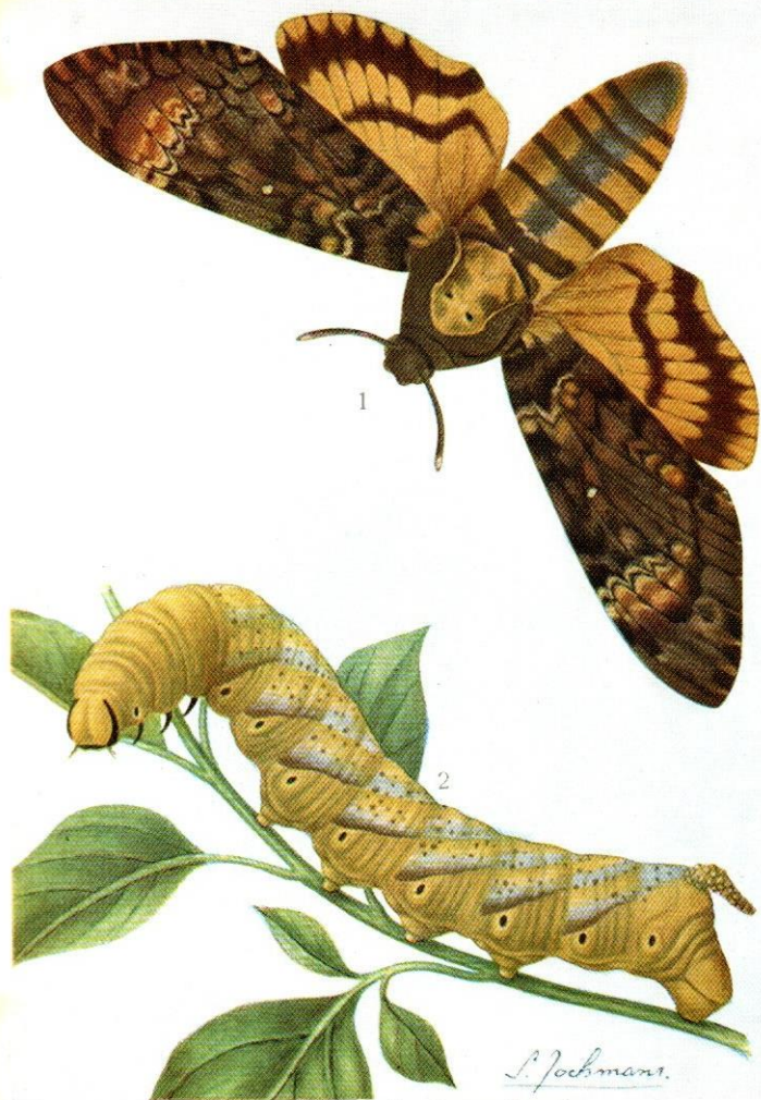
32. — Acherontia atropos LINNÉ