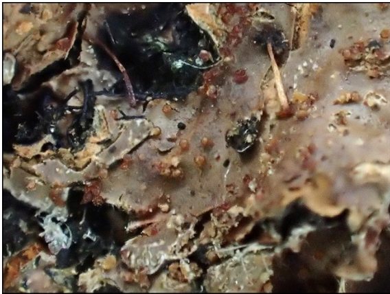
Ovicuculispora parmelia