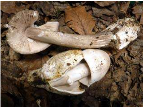
Amanita magnivolvata

Cela devient malheureusement habituel : les conditions météorologiques deviennent de plus en plus défavorables à l'apparition des champignons qui se contentent souvent de proliférer brièvement après un intermède pluvieux et passent deux ou trois jours après à l'état d'exsiccata naturel... Malgré cela, le bilan de nos Journées peut être considéré comme assez favorable, puisque nous avons relevé 470 espèces et variétés ou formes, avec quelques « raretés » comme Asterophora lycoperdoides , Cantharellus melanoxeros , Cortinarius cyanobasalis , Cyclocybe eribia , Echinoderma jacobi , Russula laccata , Russula recondita ou Tephrocybe coracina pour ne citer que celles-là. Cette notion de rareté est évidemment sujette à caution ; nous entendons ici par espèces « rares » celles qui sont peu attestées chez nous. A cela s'ajoute que certaines espèces nous sont restées méconnues jusqu'à ce qu'un spécialiste du groupe nous la fasse découvrir et qu'elle s'avère dès lors extrêmement commune ; je ne citerai comme exemple que Ramularia rubella presque toujours présent lorsqu'il y a des plants de Rumex .