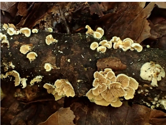
Crepidotus carpaticus