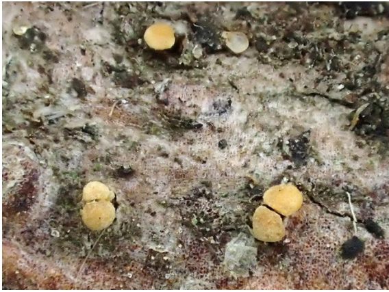
Lachnellula willkommii