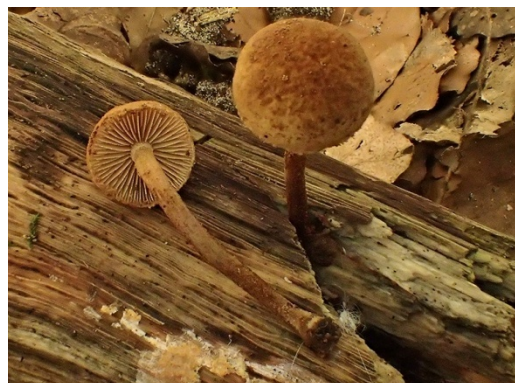
Flammulaster limulatoides