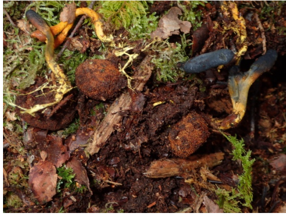
Tolypocladium ophioglossoides