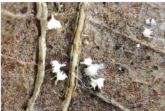
Dasyscyphus ciliaris