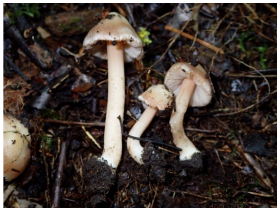
Inocybe bresadolae