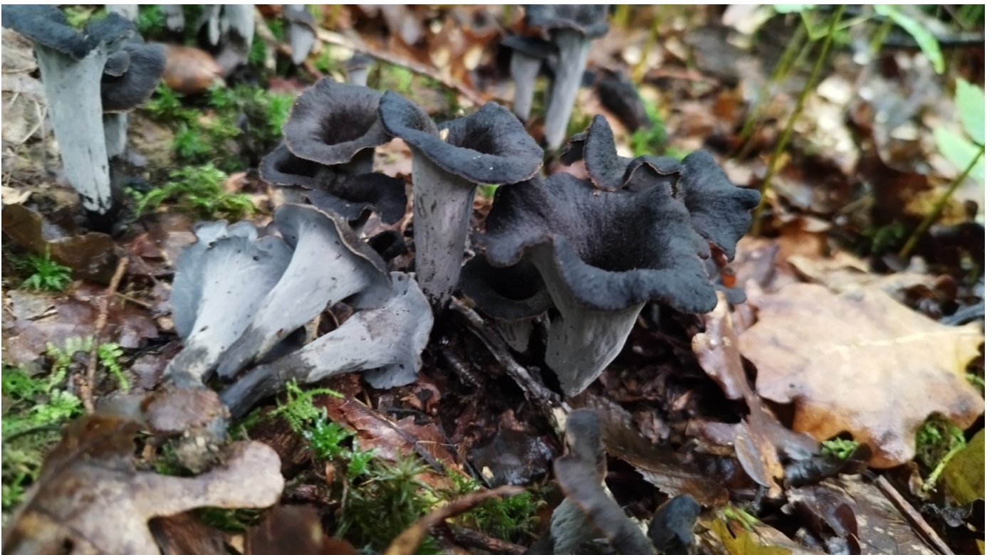
...les trompettes sonnent.