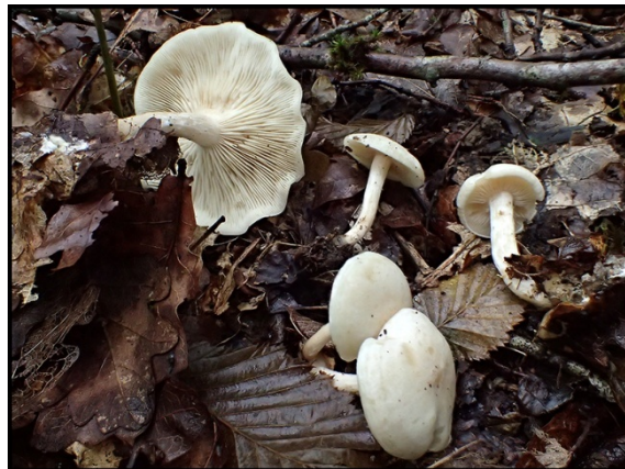
Clitocybe anisata