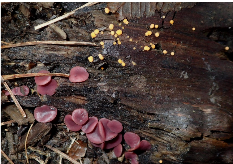
Ascocoryne cylichnium et Bisporella subpallida

A côté, deux guirlandes illuminent avec douceur et poésie cette vieille branche dégradée : Ascocoryne cylichnium , d'un violet profond, et Bisporella subpallida , d'un jaune pâle clignotant ; ce sont les responsables du rayon lumineux !