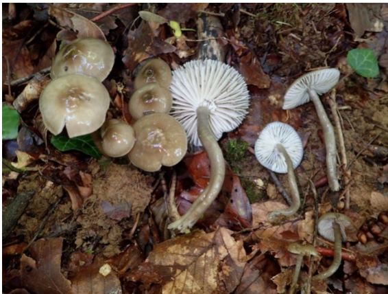
Gliophorus unguinosus