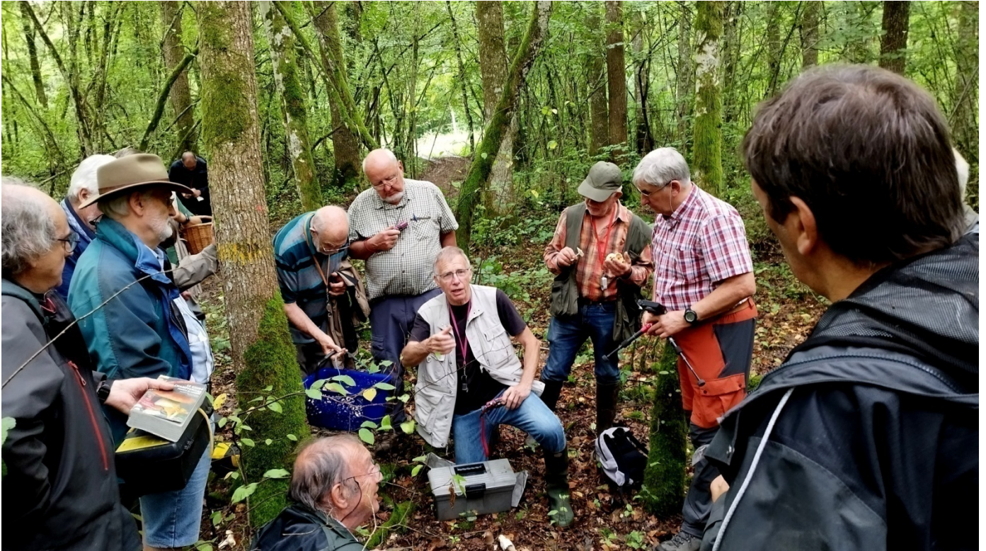
Quand le maître parle...