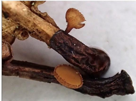
Rutstroemia sydowiana