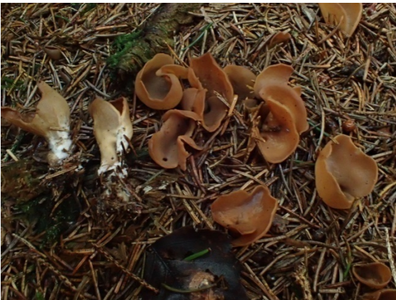
Otidea leporina