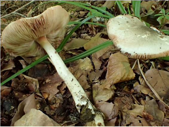
Volvariella caesiointacta